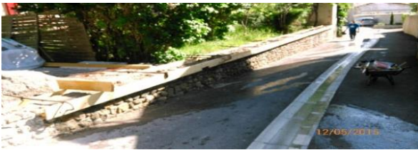
Restauration d'un mur en pierre a Chantercier (2015)