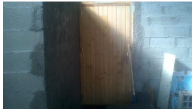
Chantier service technique de Digne les bains (2014)