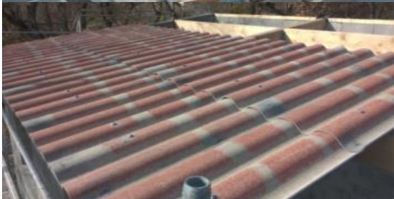
Construction d'un garage pour la commune de Mallemoisson (2015-2016)