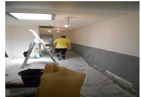
Chantier Rochette (2014)