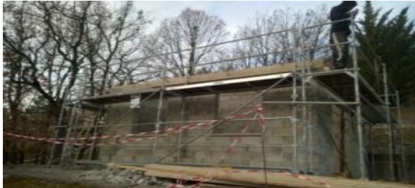
Construction d'un garage pour la commune de Mallemoisson (2015-2016)